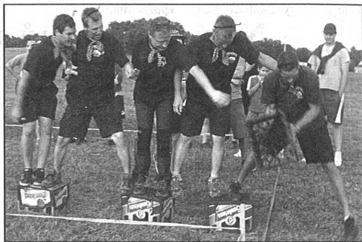
Disciplínu, během které soutěžící museli překonat trať na basách od piva, vynechali hasiči z Pikova i tým Smrkovského království. Vsadili žolíka na Brabence z Libenice (na snímku), kteří jim vybojovali 12 bodů.