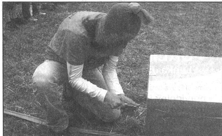
Nadějkovští každou disciplínu soutěžícím předvedli. Ta, ve které Kalamity Jane s punčochou na hlavě vykrádá trezor, měla veliký úspěch.