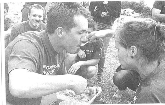
KRMENÍ. Úspěšná Jistebnice při disciplíně požívání pudinku, v němž byly nastráženy pecky. Více foto na www.taborsky.denik.cz .

Ani ne v polovině her si Brabenci z Libenice dávali velké šance: „Držíme se, je to napínavé, ale já si myslím, že na to máme.“ „Tak určitě, šance jsou.“ „Když to tam vzadu podržíme, tak můžeme i vyhrát,“ překřikovali se slovníkem fotbalistů a hokejistů.